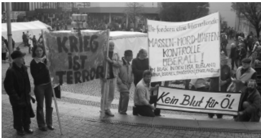
Unsere wöchentlich Mahnwache am 2.11.02 vor dem Lüdenscheider Rathaus

Hintergründe, die Interessen und die aktuellen politischen Positionen der Beteiligten werden dargestellt, um zu einer objektiven Betrachtungsweise beizutragen, die die wirklichen, nämlich die ökonomischen, Beweggründe der Kriegsparteien offenlegt. Diese Broschüre stellt die Wirtschaftlichkeitsrechnung des Krieges dar. Sie stellt die Politik der Beteiligten dem Völkerrecht und der UN-Charta gegenüber, wird die Aussichten für den Fall eines erfolgreichen Angriffs vermitteln und die Handlungsmöglichkeiten von Friedensbewegten darstellen.