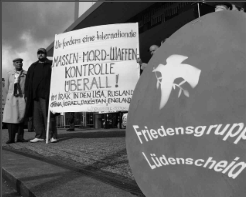
Unsere Mahnwache zum weltweiten Protesttag am 26.10.02

barten Kontrollrichtlinien und verlangte das Hauptquartier der Baath-Partei zu inspizieren, obwohl es keinerlei Hinweise für Verstöße gegen die UN-Resolutionen gab. Als der Irak dies mit Hinweis auf die Richtlinien zu Recht verbot, zog Butler die UNSCOM aus dem Irak zurück. Die USA und Großbritannien bombardierten danach in der Operation Desert Fox 4 Tage lang wie geplant ohne Auftrag des UN-Sicherheitsrates den Irak, was einen eklatanten Verstoß gegen das Völkerrecht darstellte. (6) UN-Generalsekretär Annan sprach daraufhin von „einem traurigen Tag für die UNO und für mich“. Ein ähnliches Vorgehen ist auch für die nun