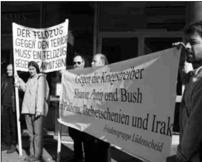
Unser wöchentliche Mahnwache am 06.04.02 vor dem Lüdenscheider Rathaus

Anzeige von Gush Shalom in der Ha'aretz vom 27. September 2002.