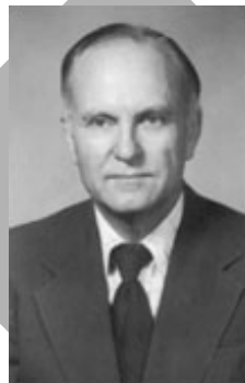
Hans F. Sennholz

sam machen, dass der sichere Hafen schwer hypothekenbelastet ist und immer weiter in die Schulden gerät. Wenn einige besorgte ausländische Investoren ihre Dollar-Investitionen aus irgend einem Grund plötzlich glattstellen, könnten die amerikanischen Kapitalmärkte unter ernstem Liquidationsdruck kommen. Wenn einige arabische Ölscheichs ihr Gewicht zum Druck hinzulegen, könnten sie eine Massenflucht beschleunigen. Der US-Dollar würde abstürzen, die Zinssätze explodieren und der Immobilienmarkt würde platzen. Es könnte die finanzielle und volkswirtschaftliche Struktur der Welt erschüttern." (2)